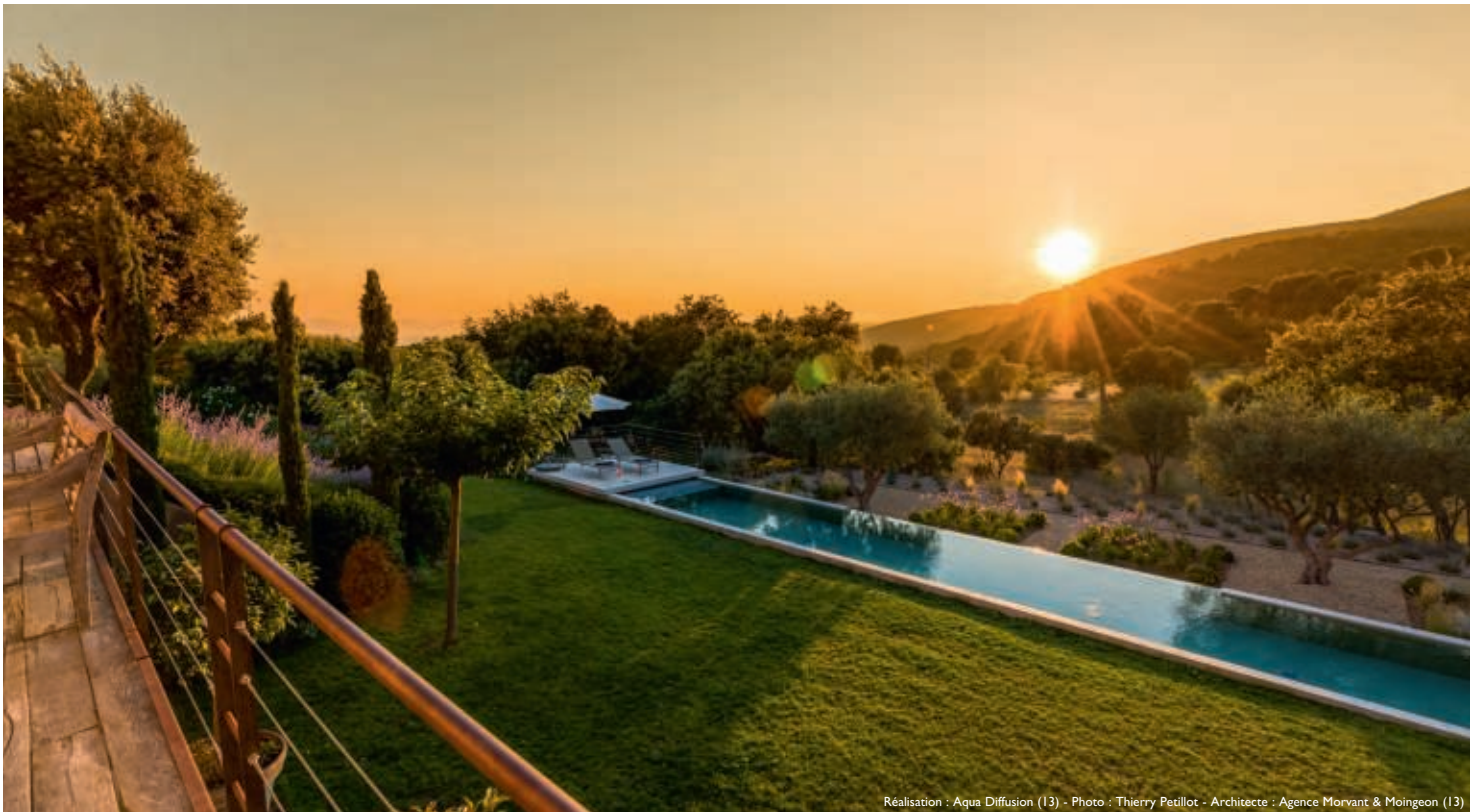
Réalisation : Aqua Diffusion (13) - Architecte : Agence Morvant & Moingeon (13)

contact@carrebleu.fr - www.piscines-carrebleu.fr