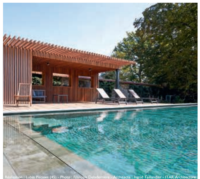
Réalisation : Lubin Piscines (45) - Architecte : Ingrid Taillandier - ITAR Architecture

Piscine intérieure miroir en inox - désinfection au chlore gazeux avec régulation automatique, chauffage par échangeur et centrale de déshumidification - couverture avec lames polycarbonate cristal.