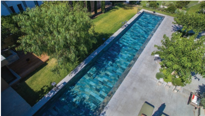
Le carrelage Green Bali ® aux dégradés de verts/argentés donne une couleur cristalline. En grès cérame émaillé, il assure la pérennité du bassin, résistant au chlore et aux fortes températures. Il est très facile d'entretien.