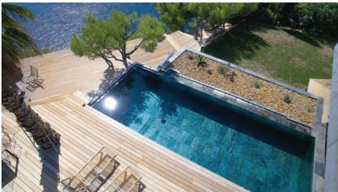
La pierre naturelle Island Green appartient à la famille des schistes et provient d'Inde. Elle a une finition douce au toucher et antiglissante. Elle existe en deux formats : 30 x 60 cm et 15 x 60 cm. Le mélange des deux tailles accentue les différences de nuances. La margelle du type pierre de lave, pierre de Bourgogne, Travertin ou autre s'harmonise parfaitement avec la pierre Island Green.